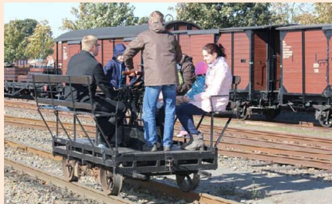
Fahrt mit der Handhebeldraisine