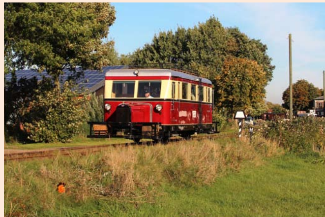
Triebwagen T41, Spitzname „Maus“

ist in der Betriebswerkstatt am Tisch „Anmeldung“