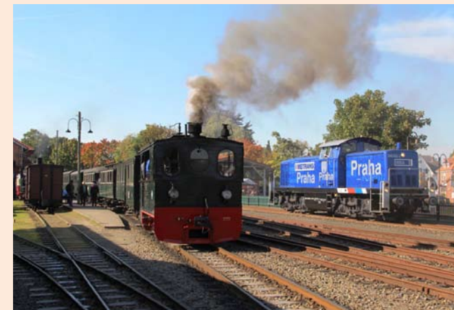
Lok 3 des DEV und METRANS Lok