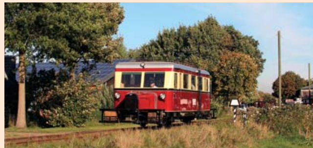
T41 - Spitzname „Maus“