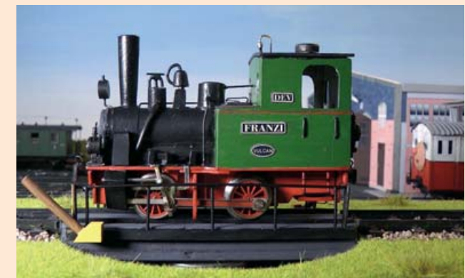
Die Abenteuer von Franzi und Welli - erhältlich im Bücherladen!