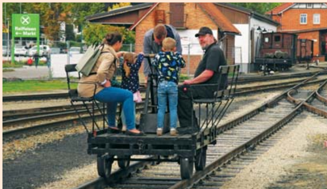
Fahrt mit der Handhebeldraisine