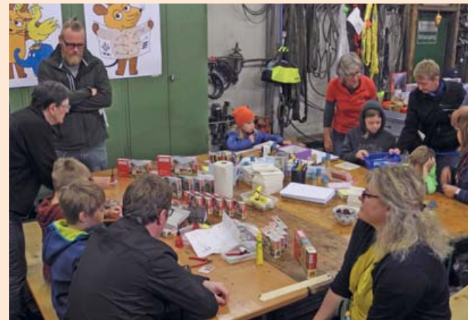
Basteltisch in der Betriebswerkstatt