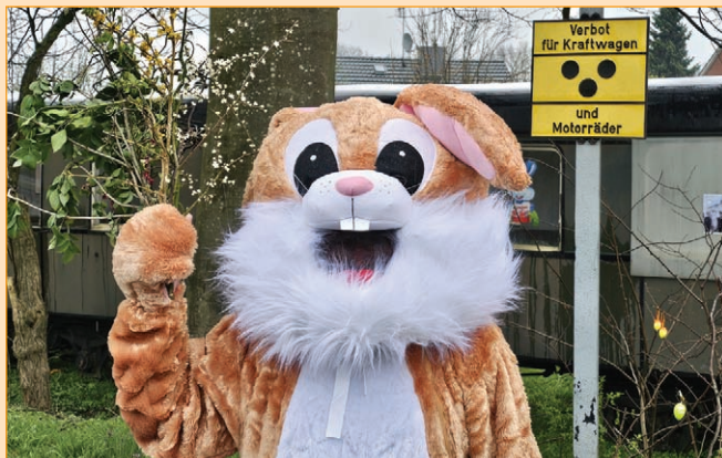
Der Osterhase wartet auf unsere kleinen Fahrgäste